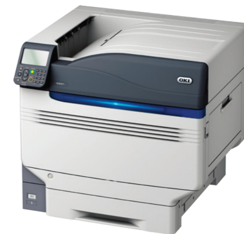
OKI OKI VINCI C941dn

FOREVER社転写フィルムと OKI データ "VINCI" ホワイトトナープリンタとの組み合わせで、すべてのユーザーへ信じられないほどの可能性を提供できます。このソフトウェアで効率的に、そしてスクリーン印刷で作成するよりも簡単に高解像度な小さな製品も作成できます。たとえ1回の転写での制作においても!